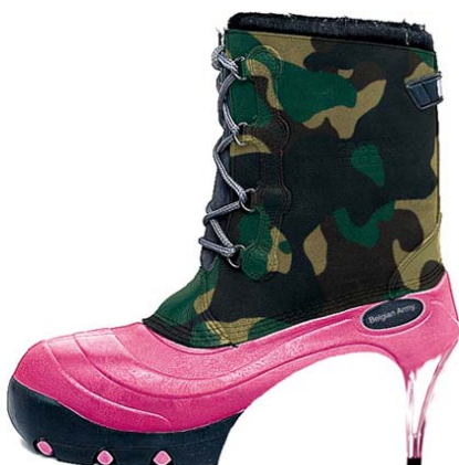
© Dimitri Reyniers, Belgisch leger - Reclamevormgeving

Het takenpakket van grafisch ontwerpers is de jongste decennia erg multidisciplinair geworden, maar het vindt vooral toepassing in grafische vormgeving, illustratieve vormgeving, interactieve vormgeving en reclamevormgeving. In elk van deze specialismen analyseert en interpreteert de grafisch ontwerper boodschappen. Die probeert hij visueel te vertalen naar een vooraf bepaalde doelgroep en via heel uiteenlopende communicatiekanalen.