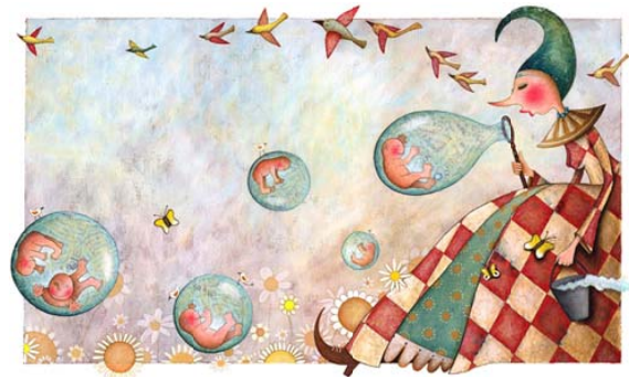
© Debby Lavreys, Boem Knots Kwats - design illustratif

Un concepteur graphique doit également se tenir constamment au courant des dernières tendances et se recycler continuellement. Si une approche orientée marché est importante à cet égard, ce qui l'est encore plus, c'est la créativité personnelle du candidat: par sa mise en forme, le concepteur aide à établir la communication, mais il crée en même temps une nouvelle réalité artistique: il est innovant d'une part, factuel d'autre part.